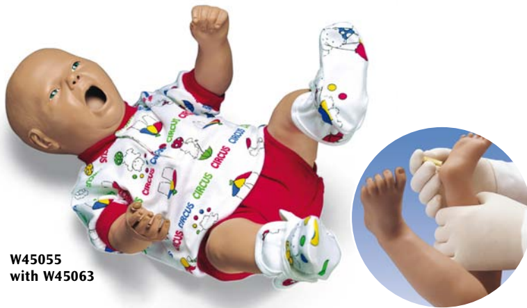
W45055 with W45063